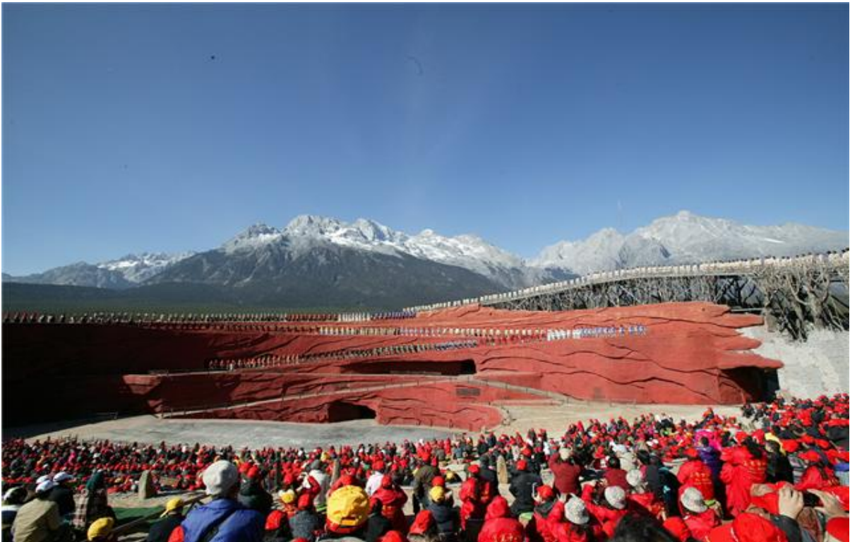
印象麗江大型戶外歌舞表演，歌曲優美，氣勢磅礴，背景為雲南玉龍雪山（楊懷曾攝於2009年12月10日）

我覺得在國內做得最好的是讓座。在我旅遊八個月期間，當我上到公共汽車或是地鐵，必定有年輕人讓座給我。有一次，我上了一輛公車，只是隔了數秒仍沒有人讓座，那售票員便大聲呼喝一位坐著的少年，要他立刻讓座給我，那可憐的少年只有低下頭站起來，把座位讓給我。反觀在香港，我在公共交通上遇到讓座給我的機會只有百分之五十。我跟一些長者談過，他們也認同，在香港，人們會讓座給孕婦、抱著孩子的人或傷殘人士，但對老人家則好像視而不見。香港市民的公民意識比內地強，但在讓座這一環則比國內的差很多。是香港人缺了點愛心，還是他們多了點自私？