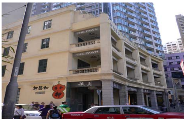
位於電車路之和昌押，已改為西餐館。