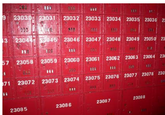
前灣仔郵政局內之舊郵箱。現用來放置單張。