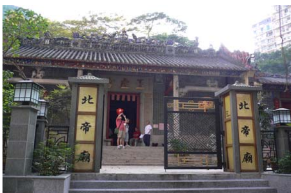
位於石水渠街之北帝廟大門，屋脊上的石灣公仔十分精緻。