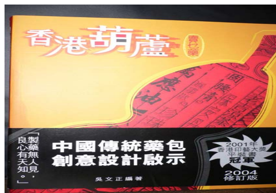
此書在灣仔民間生活館出售，收集了很多香港出產成藥的包裝紙，十分懷舊！