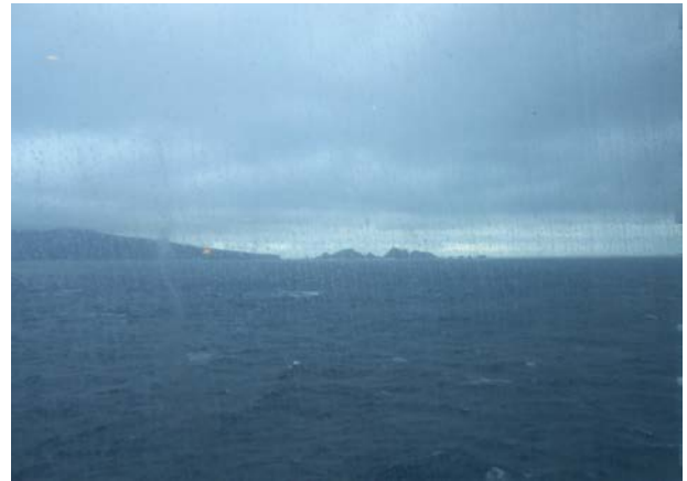
信不信由你，這就是世界的盡頭！