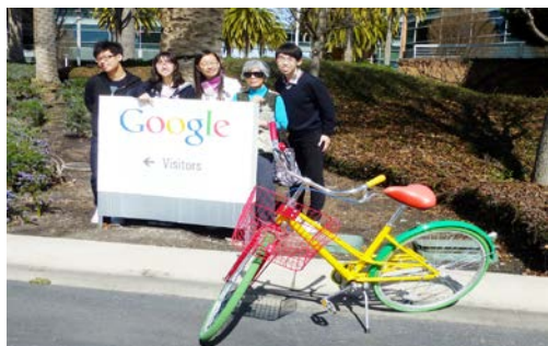
參觀 Google 後合照