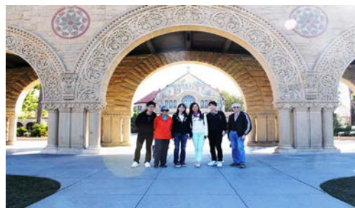
參觀史坦福大學後在小教堂前留影