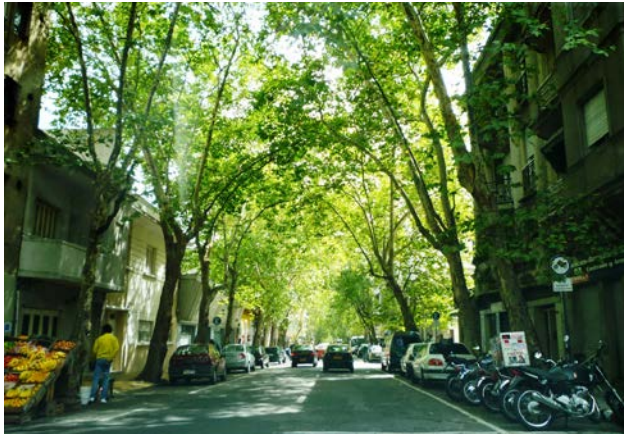
烏拉圭首府住宅區綠樹成蔭頗像昔日的澳門

我們所乘的遊輪約五年新，是個龐然巨物，活像一座浮在海上的大酒店，船長是意大利人，船上工作人員近二千，多來自菲律賓或東歐。乘客約三千，來自世界各地，印象中來自非洲的乘客較少。船上吃喝玩樂設施和中西美食，式式俱備，應有盡有。房間雖少，但設計精巧，設備齊全。在郵輪上，我們住得舒服，吃得滿足，玩得開心，唯一遺憾者，是未有機會品嚐到智利馳名的鮑魚和海參。