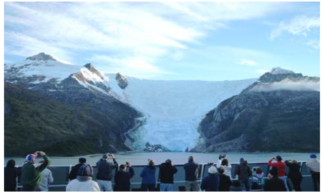
麥哲倫海峽東北岸有多處冰川氣勢磅礴

本次航程共經過七個大小海濱城市，南美洲的海岸線長而且美麗。在郵輪停泊的港口，我們都會上岸走走，那裡的教堂、博物館、墳場、民居、市集等，均具南美風韻和拉丁浪漫氣息。在這些旅遊城市可用美金，超級市場貨品較美國貴兩、三倍者為數不少，但居民的年均收入只有一萬多美元，生活擔子不輕呀！這裡的上網費用也很貴，除酒店外，很難找到免費上網的地方。所到小城都有賭場、麥當勞快餐店和類似美國一元商店的雜貨店，但價格則由五元開始，賣的多半是我們祖國的產品，熟口熟面，今日中國貨無遠弗屆，我們能不自豪？智利和阿根廷之間隔着重重崇山峻嶺，過去太平洋與大西洋間的貿易往還，要繞過長長的海道，現在這裡開通了隧道，南美諸國的貿易，路程縮短了，希望運費降低後，商品價格亦隨之下降，造福南美民眾。