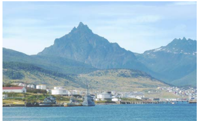
南極補給站石油庫有兩艘阿根廷炮艇在看守