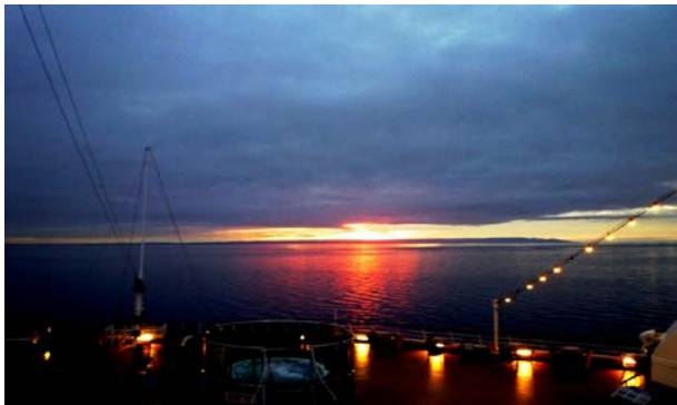
達爾文峽流的日出紅勝火既寧謐又壯麗

南美洲形狀像舌頭，舌尖最南端有個小島叫 Cape Horn，俗稱世界盡頭(The End of the World)，是筆者心儀已久的旅遊地點。年初趁空檔時間，與老伴參加了南美郵輪旅程，由智利北部小城登船，沿太平洋東岸南下，繞過世界盡頭，沿大西洋西岸北上，經烏拉圭到阿根廷首府布宜諾斯艾利斯離船飛邁亞密，轉乘內陸航機返三藩市，行程兩周。今次陸海空漫遊，給了我們一些新的體驗。