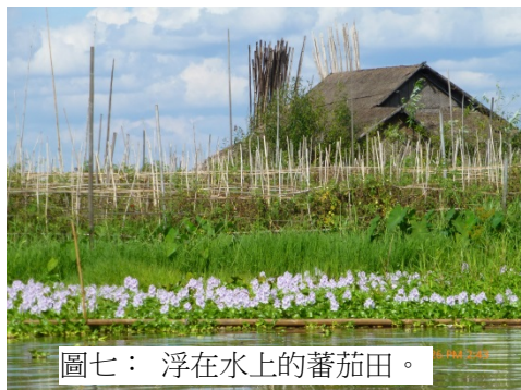
圖七：浮在水上的蕃茄田。

從卡羅市開車到印拿湖的碼頭，祇要一個小時的車程。想不到這個山城竟然可以協助我們調整從燦爛歸於平靜的心理狀態！我們曾經參觀了一處水上村莊，要轉乘祇坐兩人的小艇在窄窄的水路上穿梭，除了近距離看到民居外，還見識了種植蕃茄的水上農莊。這兒的蕃茄，向全國提供了40%的供應量。為了保護環境，政府已經禁止了村民繼續開墾此種作業面積！由於這種農莊是在水上漂浮的，農民使用竹枝插在湖底夾著土架，使祇能上下浮動，不會漂流往別處。這兒水平如鏡，倒影處處，景色十分省鏡！環境清靜得祇聽到船槳打在水上的聲音。偶爾還見到一兩小孩用單腳撐艇迎面而來。不知何故，竟然想起了《水滸傳》中的梁山泊，不知是否同一景象？阮氏三兄弟的水性，是否就是這樣訓練出來的？