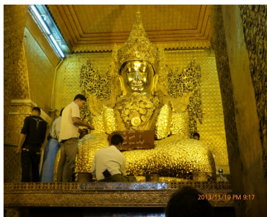
圖二：此佛像位於孟德里，祇准男士進入貼金。由於金泊太多，其形態已變得不成比例。