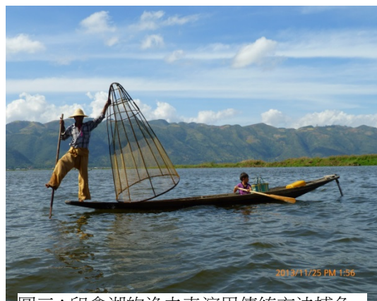
圖三：印拿湖的漁夫表演用傳統方法捕魚。