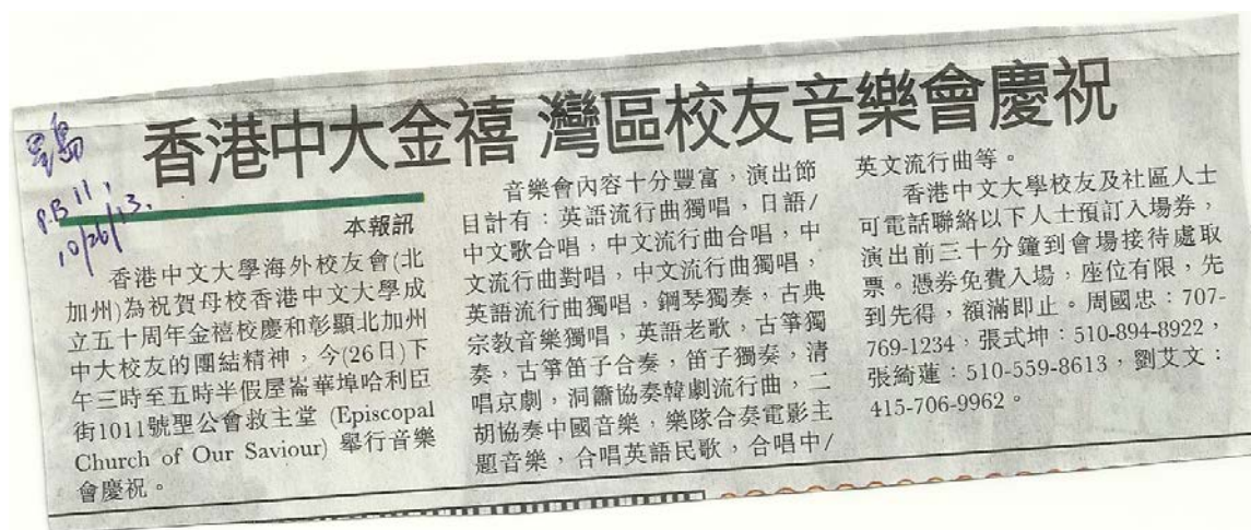
星島日報有關本會舉行金禧紀念音樂會的新聞報導