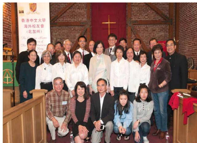
工作人員於音樂會後合照