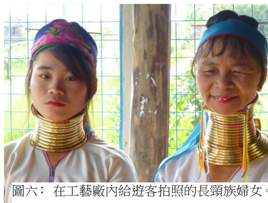
圖六：在工藝廠內給遊客拍照的長頸族婦女。

從卡羅市開車到印拿湖的碼頭，祇要一個小時的車程。想不到這個山城竟然可以協助我們調整從燦爛歸於平靜的心理狀態！我們曾經參觀了一處水上村莊，要轉乘祇坐兩人的小艇在窄窄的水路上穿梭，除了近距離看到民居外，還見識了種植蕃茄的水上農莊。這兒的蕃茄，向全國提供了40%的供應量。為了保護環境，政府已經禁止了村民繼續開墾此種作業面積！由於這種農莊是在水上漂浮的，農民使用竹枝插在湖底夾著土架，使祇能上下浮動，不會漂流往別處。這兒水平如鏡，倒影處處，景色十分省鏡！環境清靜得祇聽到船槳打在水上的聲音。偶爾還見到一兩小孩用單腳撐艇迎面而來。不知何故，竟然想起了《水滸傳》中的梁山泊，不知是否同一景象？阮氏三兄弟的水性，是否就是這樣訓練出來的？