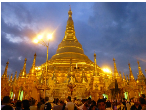
圖一：在仰光的黃金佛塔浴在夕陽中，人群擠得水洩不通。

三十多年前與緬甸擦身而過，本來參加了一個學習團前往仰光，可是突然因聯合國秘書長緬甸籍的宇丹逝世，引起仰光學生暴動而行程被迫取消。今年因乘參加中大五十周年慶典之便，在美國參加了一探索團前往緬甸觀光十二天，深入的了解緬甸的風土人情。由於所到的地方，包括仰光、碧澗(Bagan)、孟德里(Mandalay)、卡羅(Kalaw)、及印拿湖，覆蓋的地域範圍甚廣。但篇幅所限，此文章祇集中介紹鮮有人去的印那湖。