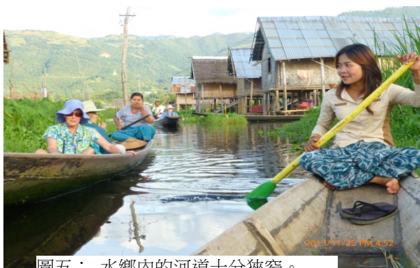
圖五：水鄉內的河道十分狹窄。

向日葵，難怪當年英國人選擇了這個城市作為避暑聖地、進口了大量的印度人及尼泊爾人修築鐵路直達仰光。這個城市沒有被信徒貼金到連佛像的體型也變得不成比例、或是金光燦爛的塔頂，有的祇是用木搭成的簡樸廟宇，我們被安排與僧侶主持對話，了解靜坐冥想的意義；也曾被安排分成小組，提著竹籃往當地市場買菜、然後到一農家用柴火燒飯，飯後再和村民談話了解他們的生活；我們和另兩位團員也曾自行前往當地一間有百年歷史的天主堂參加耶穌君王慶典、在未進入聖堂前，驚嘆信友們在馬路上用松葉、紅花及黃花鋪成像地毯一樣的圖案，一路鋪至小聖堂，以便聖體出遊。