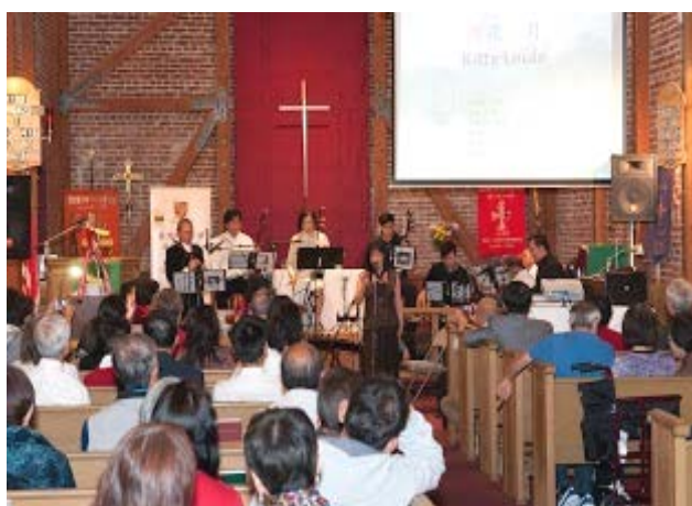
當日音樂會演出的情況

【2013年10月26日】本會為了慶祝母校金禧，特別於2013年10月26日在屋崙市舉行音樂會，本次音樂會的表演項目多姿多采，反映中大人博古通今、中西共冶的寬宏視野，項目包括：英語流行曲獨唱，日語/中文歌合唱，中文流行曲合唱，中文流行曲對唱，中文流行曲獨唱，英語流行曲獨唱，鋼琴獨奏，古典宗教歌曲獨唱，英語老歌，古箏獨奏，古箏笛子合奏，笛子獨奏，清唱京劇，洞簫協奏韓劇流行曲，二胡協奏中國音樂，樂隊合奏電影主題音樂，合唱英語民歌，合唱中文流行曲，中文勵志流行曲等。蒞臨指導、欣賞的校友及親朋眾多，全場爆滿，場面歡愉、熱鬧、溫馨，為母校金禧增添姿彩！