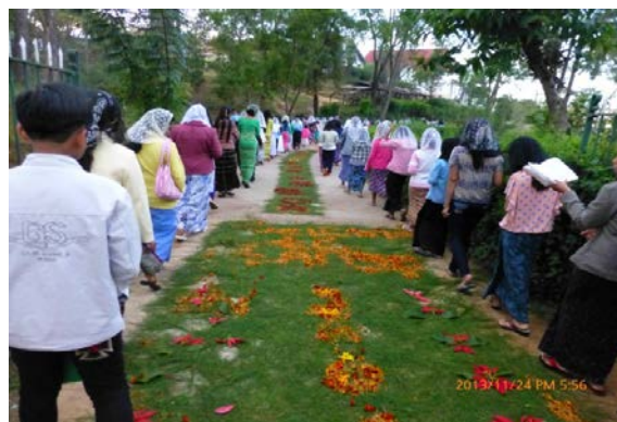
圖四：天主教耶穌聖體巡遊。路上鋪的圖案是用松針葉及不同顏色的花朵砌成。

印那湖是緬甸(現在稱為 Myanmar 國)第二大湖，由於位於海拔二千九百呎的高山上，氣候宜人，平均湖水深度為十呎而且十分平靜，出入皆要坐水上交通工具。從碼頭到旅館摩托平底船要走四十分鐘。水上交通並不繁忙。在仰光、碧澗、孟德里等地參觀的金碧輝煌廟宇、用五光十色閃亮的霓虹燈來裝飾佛像頭頂上的光環、人潮熙來攘往，來到印拿湖，望著平靜的湖水，間中有漁夫用他們獨特的單腳划艇的方式，一面用像圓錐形的漁網向遊客表演他們的傳統捕魚方法。藍天白雲，襯著漁夫褐黃色的衣服，簡直就是一幅美麗而寧靜的圖畫。