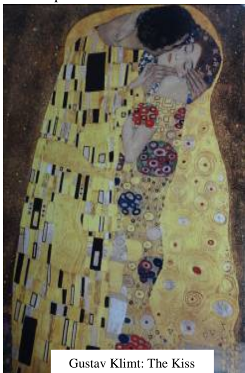
Gustav Klimt: The Kiss

To put it differently, “kissing” has found expressions in multi-dimensional, then in single-dimensional, and returning once again to multi-dimensional forms. My talk is about the vicissitudes revolving this intriguing artistic phenomenon.