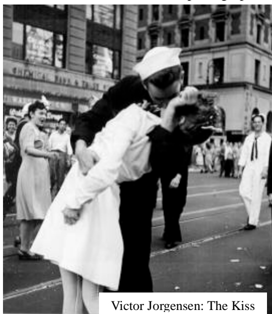
Victor Jorgensen: The Kiss

To conclude, some assessments of the social impacts of the movement are necessary. For this matter, I plan to invite the attendants to participate in an open discussion. Such a forum should enable us to share different perspectives on this issue.