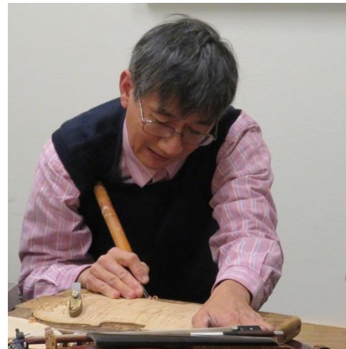
林先生示範彫鑿琴面，放在琴面上的就是小刨。