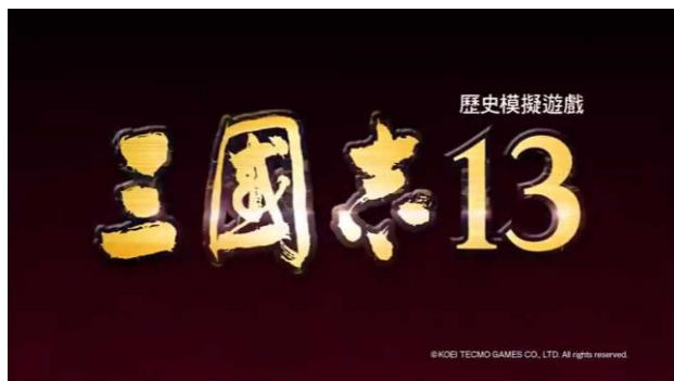
2015年發買，三國志遊戲系列之新作

要數經典的三國志題材遊戲，首選必然會是由日本光榮遊戲公司(註：現稱為光榮庫摩)所開發的三國志遊戲系列。該系列由1985年開始發售，歷三十年而不倒。雖然到2015年為止總共13集之中偶有爛作，