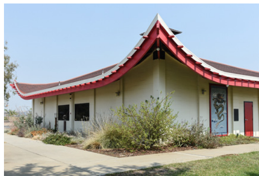
1970 年落成的 Chinese Camp 小學，由當地居民歷史學家 Dolores Nicolini 設計，屋頂模仿中國亭樓的飛簷翹角。這算是紀念曾經在華人營作過重大貢獻的華人吧。

華人在此市鎮歷史，前後大約七十年。其中最令人津津樂道的，應該是 1856 年發生的那場大械鬥了。西報說這是一場 1200 三邑幫對 900 人和幫的大對決，有四人死亡。在 120 公路入口處樹立的紀念碑中，也有提到這件事，說是加州歷史上第一次華人「堂鬥」。這是錯誤的，因為那時華人社會還未出現所謂堂口，有的只是地域性的會館。姑勿論這是堂鬥還是械鬥，第一次是 1854 年在 Weaverville 發生的，我們校友會去年北加之旅時曾參觀過遺址和紀念碑。1856 年那場械鬥，性質上與十九世紀末期到二十世紀初期在舊金山發生的堂鬥有點不同，它並不涉及商業利益，而是基於狹窄畛域觀念，由私人恩怨演發成集體武鬥，為自己鄉親爭面子，出口氣。這次械鬥的起因，只是幾