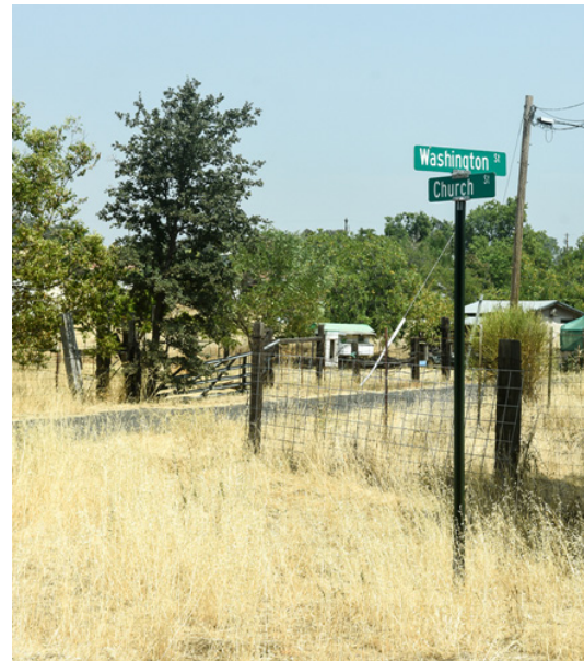
Washington 夾 Church 街是以前唐人街的地標，現在 Church 街已全部被雜草吞沒。

再走一段陸路，而華人營是必經之地。華人如何和華人營扯上關係？有幾個不同說法，比較可信的是：1849 年，有四個英國人投資了二萬元在澳門買了條船，並僱用了 35 名華人來加州掘金，合約為期兩年。他們帶備了兩年的物資和糧