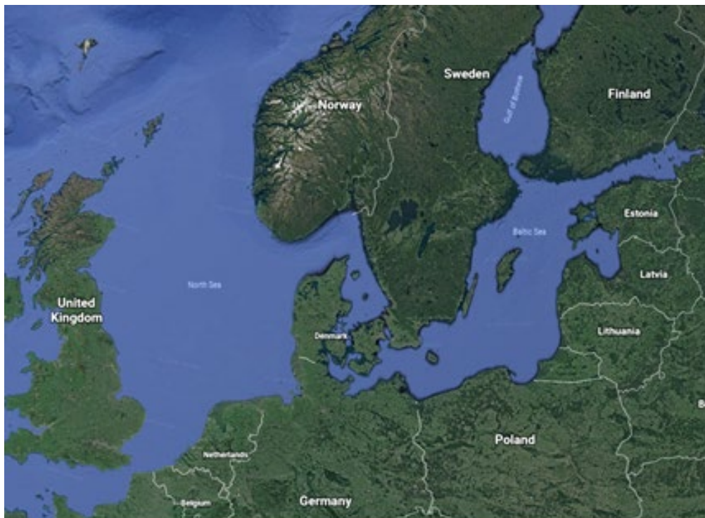
上圖：北歐波羅的海與鄰近國家位置