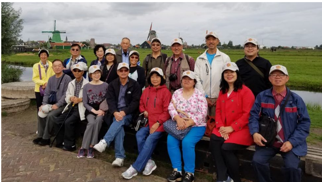
上圖：在荷蘭風車村前集體照