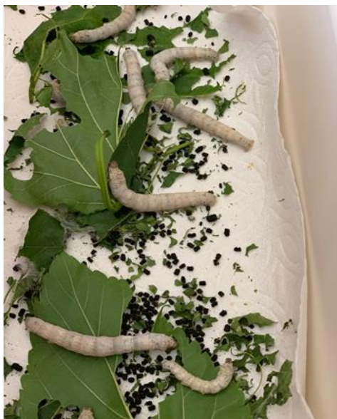
圖二 蠶蟲蠶食桑葉的情境

後，是不會飛的，在紙巾上誕下了卵子便會死掉。女婿和她把那些卵子收藏在盒子內好，直至明年春天，桑樹發芽的時候，卵子便會變成幼蟲，跟著便是我們體驗到的吐絲結繭情況，如是一代傳一代，成了我們中華民族數千年來引以為傲的、影響全世界的服裝物料。