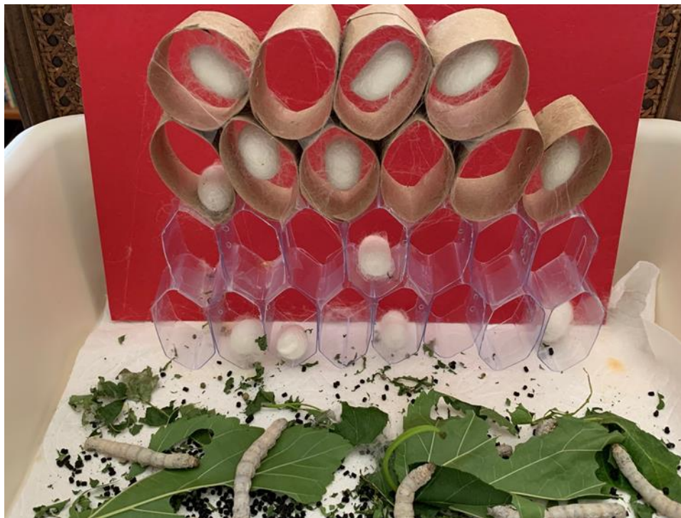
圖一 這是第三天的結繭情況

第一日已有三個蠶兒結了繭。由於我通常睡得晚，在電腦桌前看得太長時間便要歇歇眼神，便走出客廳看蠶兒吐絲，祇見那些「胖嘟嘟」很努力的往上爬。它們似不喜歡那些用塑料製成的蜂巢洞而喜歡用廁紙筒製成放在上層的洞穴。它們的足爪十分厲害，下盤的多雙足爪固定了位置後，上半身便不停的往外擺動，不知是在探索，還是像我們懷孕婦女生產前的陣痛反應？實在不忍看著它們的掙扎，便把燈关掉讓它們安安靜靜的吐絲好了。第二天，又多了兩三個雪白蠶繭排在廁紙筒內，其中一個在太陽光照下，仍隱約看到繭內的蟲兒蜷縮在掙扎，體型明顯消瘦了。