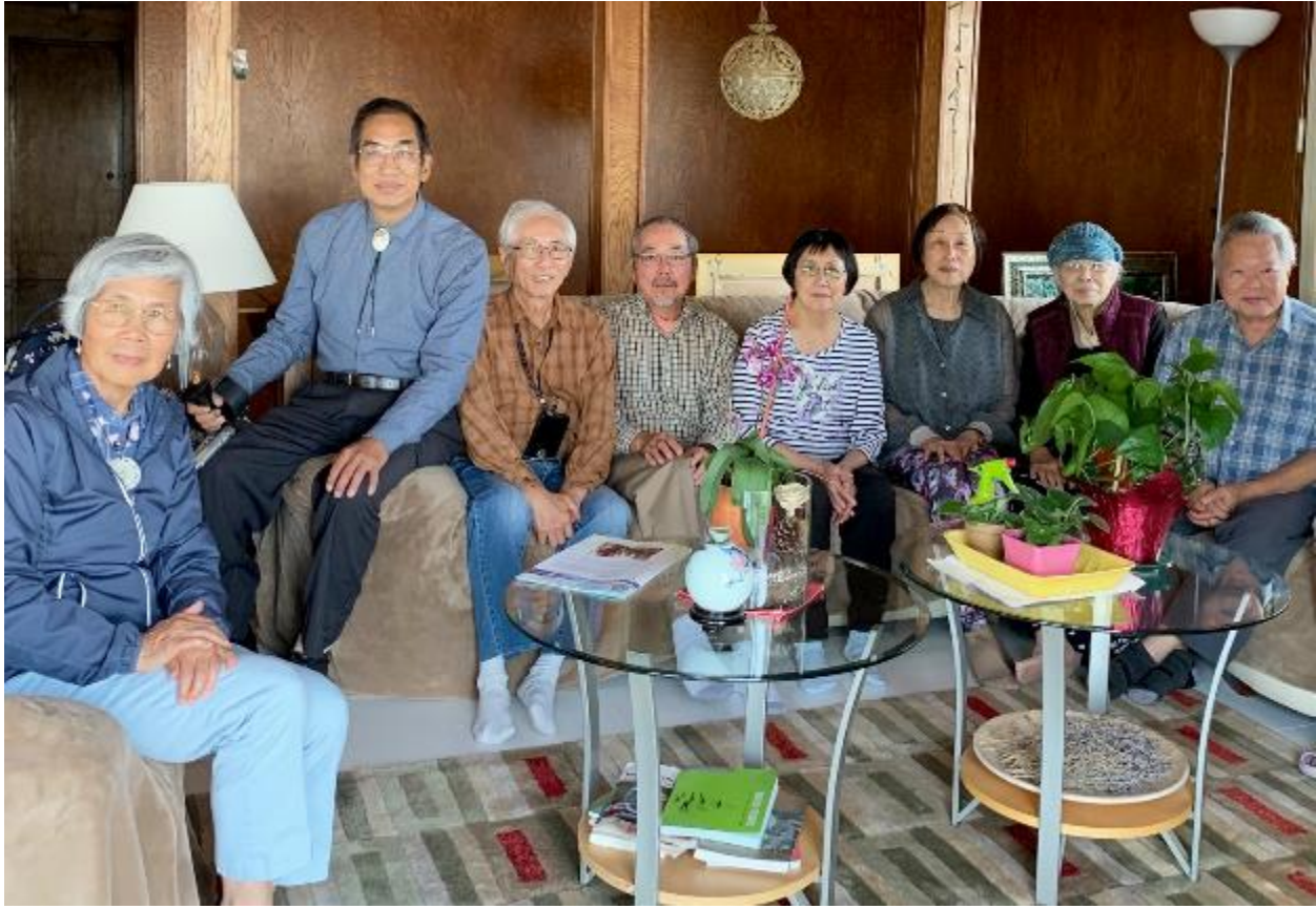
Lunch get-together on 2019 Aug 21