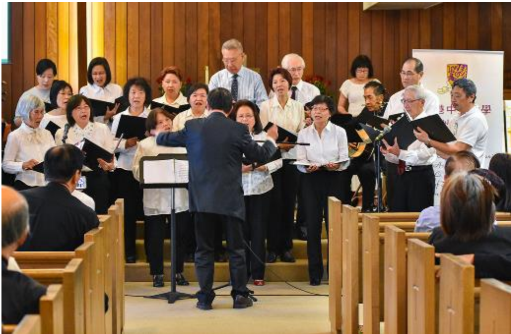
2017 年 10 月在柏克萊舉行的聯合音樂會