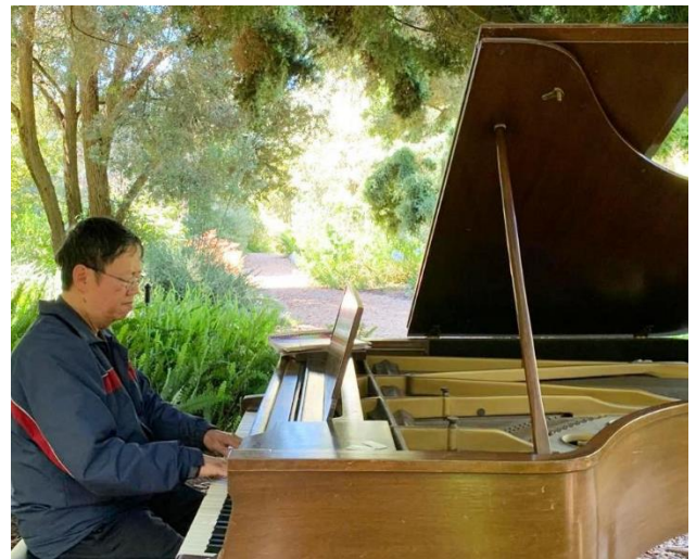
2019年7月筆者在三藩市金門公園戶外舉行鋼琴演奏

備註：敬請大家留意此鋼琴演奏會的延期（仍會在一個星期六下午同一地點舉行），到時請光臨指教！