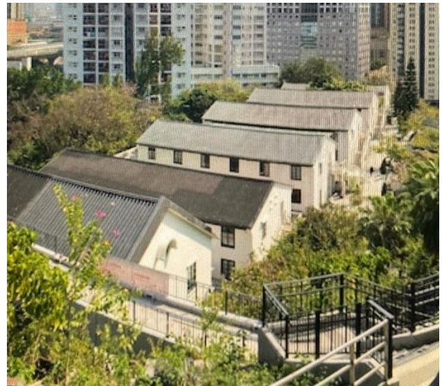
此乃網上翠雅山房的航拍照片，背景為美孚新邨

2019年入住的翠雅山房，位於整座建築群的上區，所有的外牆皆油上了白色掩蓋了當年的褐色磚塊。內部下層間了十個房間，裝修十分簡約，有淋浴及抽水馬桶，也提供了電冰箱，電熱水煲及電子保險箱等設備。面積雖然並不寬闊，但是麻雀雖小，五臟俱全。數位年青人輪流當值，身兼接待、電話接線生、技工、Bell Boy等職位，態度十分熱誠。整個上區有89個房間。是一所小型旅館，分散在四座建築物內。