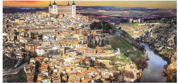
Toledo old town built on a hill and flanked by a river

unique cultures as reflected in their architecture (the Spanish castles— Alcazar in Segovia's , cathedrals, basilicas, monasteries and missions), music, arts, bullfights, even merchant and battle ships especially of Portugal (a seafaring nation). Many of these artifacts (potteries, costumes and dance such as the famous Flamenco) are exhibited and represented in notable museums attracting millions of visitors worldwide each year.