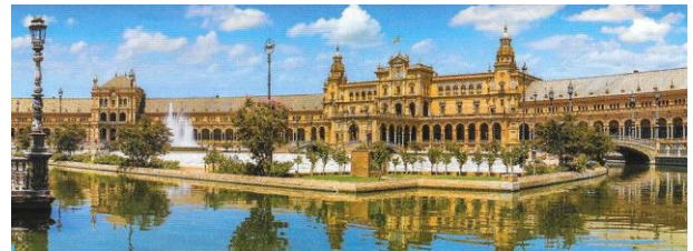
The extensive Plaza de Espana (Spanish Plaza/Square) in Seville

In considering their language and dialects, we could hear the genuine Spanish accents which are not quite the same as those spoken here in California and Latin America. Also, many famous Spanish street names we see in the SF Bay Area and Greater Los Angeles did originate in Spain and not to mention about the world-famous Spanish cuisine like piaja , a mixed seafood simmered rice dish, along with fish, tortillas, bakery goods and snacks called tapas which we enjoyed.