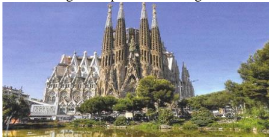
La Sagrada Familia church in Barcelona

Spain and Portugal had been on our ‘touring list’ for a long time and since it was our first visit there, we really looked forward to a 15-day small group tour (16 people). The group size was comfortable when compared to the hustle and bustle of a large group packed in one coach bus. However, one adverse effect of travelling in a small group is that we needed to be more vigilant and aware of the infamous pick-pocketing activities at tourist locations throughout Spain and Portugal.