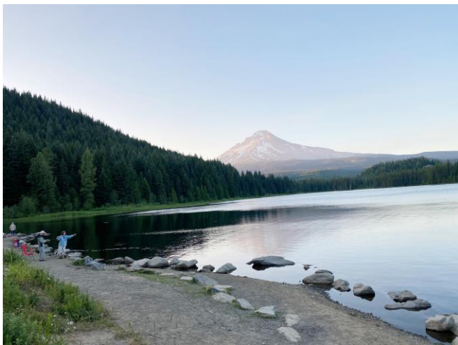
Mt. Hood 山頂在日落時一景