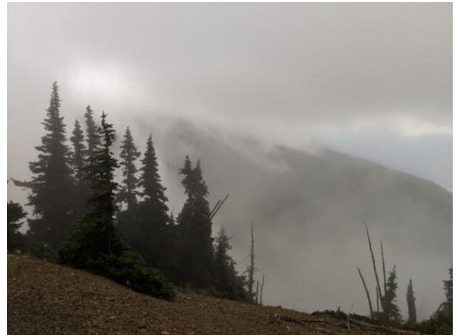
Hurricane Ridge 霧景