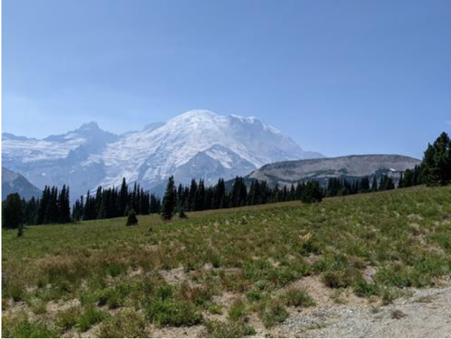
遠眺 Mt. Rainier

疫情已經超過一年，人總不離開住家和工作，心情不自覺鬱悶。這次旅程難得為耳目一新，期待能再訪西雅圖。