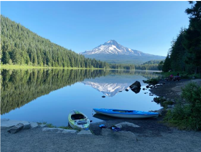
這是在 Mt Hood 山下 Lake Trillium 晨早的湖光山色

(salmon), 比目魚 (halibut), 鱈魚(cod), 鱘魚 (sturgeon) 等, 都要立即填寫, 資料包括捕獲日期及地點, 魚的長度, 野生的還是孵化場放養的, 若是後者, 魚鰭上會有標籤。友人說她釣了四年魚, 祇有一次在深海釣到一條鰭上釘有標籤的三文魚, 當時她們要將標籤剪下, 寄回漁務處。看來這些從釣客提供的資料, 是給漁務處作研究深海魚行踪之用。由於我們祇會在附近的湖泊垂釣, 獨沽一味祇有鱈魚, 故此不用填寫此表格。而湖泊內的鱈魚, 是由孵化場人工孵化了受精的魚卵後, 在魚場養到一定的長度, 便會每月一次在湖泊內放養, 任人垂釣, 少於八吋的, 便要放回湖中。看來我們非居民的漁牌費用, 很大可能是用來贊助漁務處的支出!