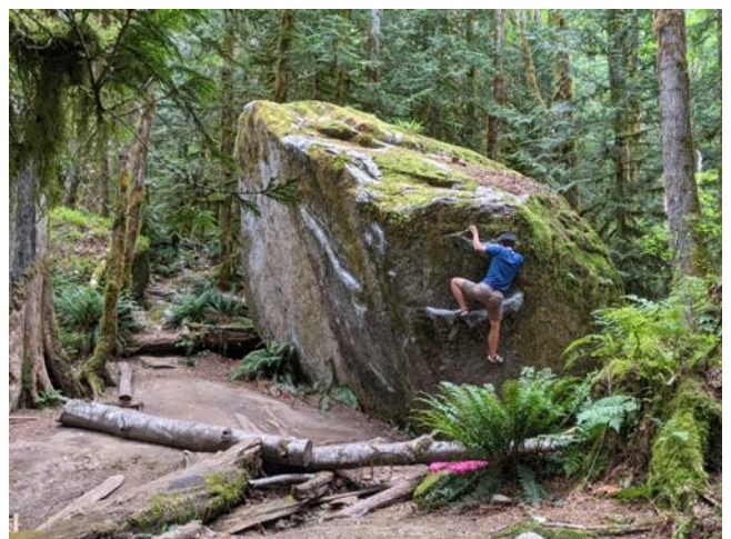
校友朱傑生(崇基物理 2016) 在 Index WA 攀石