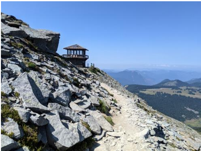
Mt. Fremont Lookout